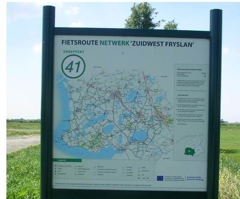
Informationstafel an einem Knotenpunkt