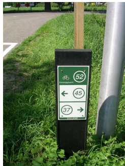
Knotenpunt 52 Knooppunt 52