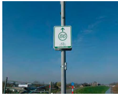
Wegwijzer zum Knotenpunt 86 Wegwijzer naar knooppunt 86